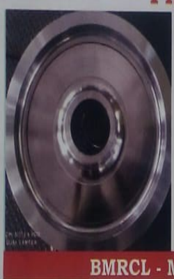
BMRCL - MACHINED