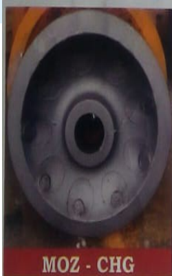
MOZ - CHG