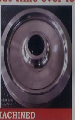
BGC - ICF